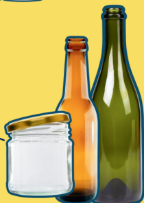
glass bottles & jars