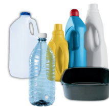
botellas, cubetas, y bandejas de plástico