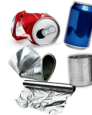
tin & aluminum cans and foil