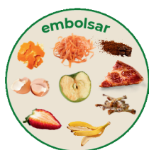
restos de comida en bolsas