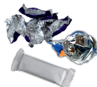
envoltorios de botanas y dulces y bolsas de papas