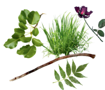
recortes de jardín sueltos