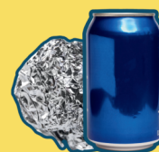
aluminum cans & clean foil