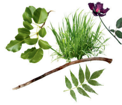
loose yard trimmings