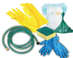
pañales, residuos de mascotas, guantes, esponjas y mangueras