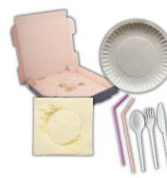
cuchillería de plástico, platos de papel, cajas de pizza, servilletas y pajitas