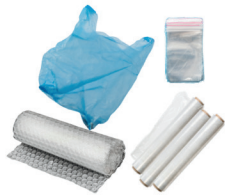
bolsas de plástico, envoltura y plástico de burbujas

Deposite todos los artículos no reciclables ni orgánicos en el carro negro para que vayan al vertedero.