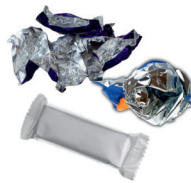
envoltorios de botanas y dulces y bolsas de papas