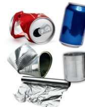
latas y papel de aluminio