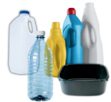
botellas, cubetas, y bandejas de plástico