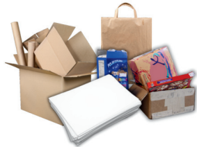
papel de oficina, cartón y bolsas de papel