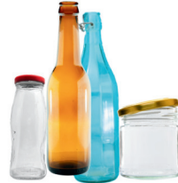
glass bottles & jars