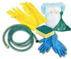
pañales, residuos de mascotas, guantes, esponjas y mangueras