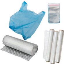
plastic bags, film, & bubble wrap

Place all non-recyclable, non-organic items in the black cart to go to the landfill.