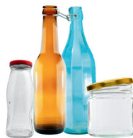
botellas y vasos de vidrio