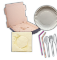
cuchillería de plástico, platos de papel, cajas de pizza, servilletas y pajitas