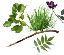
loose yard trimmings