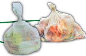
bagged food waste/scraps