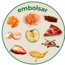
restos de comida en bolsas