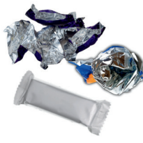
snack and candy wrappers & chip bags