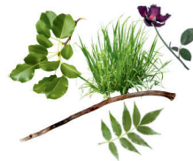
recortes de jardín suelos